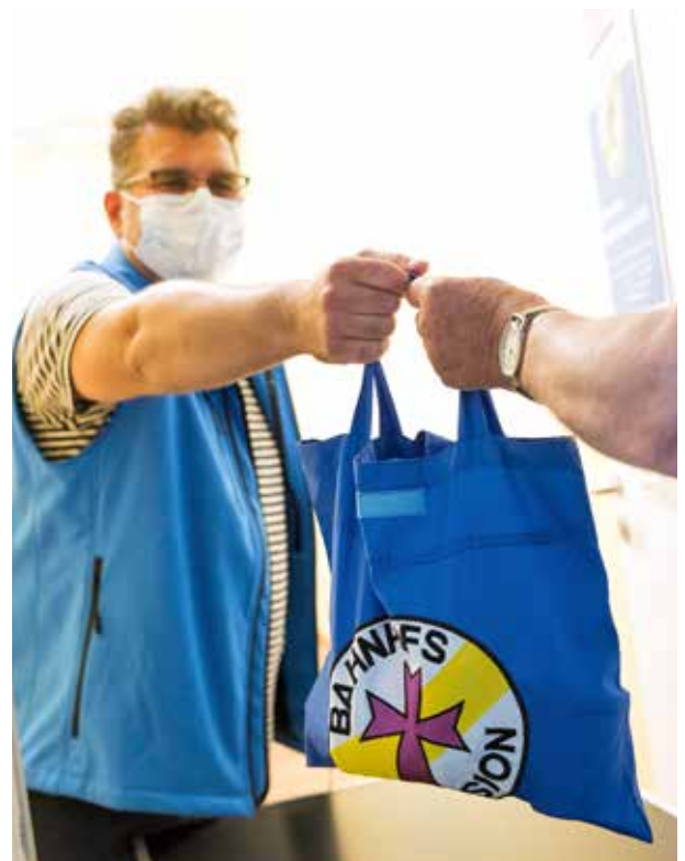
Die Ehrenamtlichen der Ökumenischen Bahnhofsmmission Lübeck sind auch für Menschen in sozialen Notlagen da.